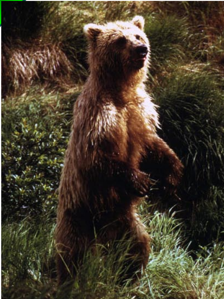
L'urs stat si per pudair observar e savurar meglier.

En l'Europa vivan ils urs sparpagliads en differents territoris. I dat mo paucas populaziuns grondas en il nord da l'Europa (Finlanda, Russia e Scandinavia) ed en l'Europa orientala (Carpatas e Balcan).